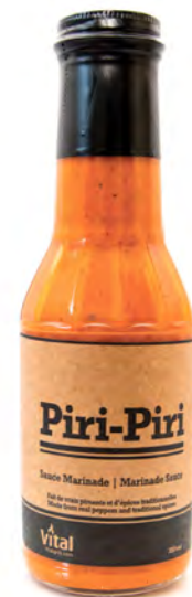
1108 Sauce marinade Piri-Piri Piri-Piri marinade