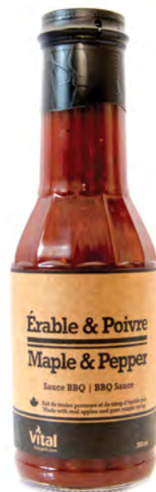
1107 Sauce BBQ érable et poivre | Maple & pepper BBQ sauce